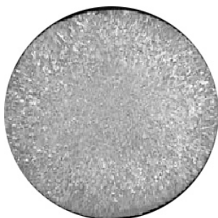
Kokillenguss 680 °C

Welchen Einfluss auf das Gefüge haben Gießtemperatur und Abkühlungsbedingungen?